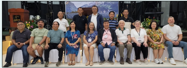
Regionalleiter (hinten), Vorstand CFF und die Besucher