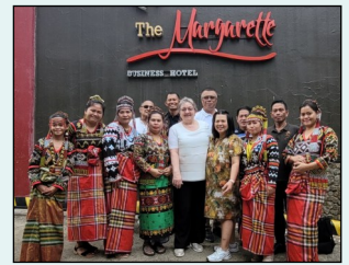
T'Boli-Frauen in Tracht